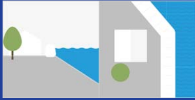
ปกป้องกันอุบัติเหตุ