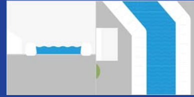
สกัดกั้น เปลี่ยนเส้นทางน้ำ