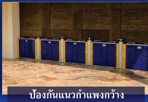
ป้องกันแนวกำแพงกว้าง