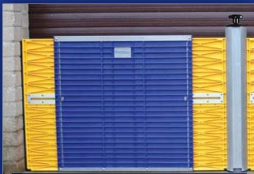
ประตูกั้นแบบเดี่ยว และส่วนขยายความกว้าง 780-1,100 มม.