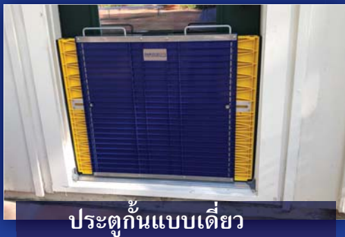
ประตูกั้นแบบเดี่ยว