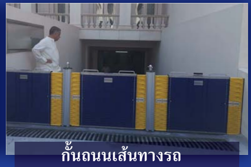
กั้นถนนเส้นทางรถ