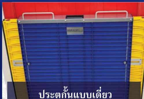
ประตูกั้นแบบเดี่ยว และส่วนขยายความหนา 500-800 มม. เปิดตัวสินค้าปลายปี 2564