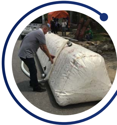
Mobile water tanks

ด้วยการออกแบบวัสดุแท็งก์เก็บน้ำที่แข็งแรง ทน ประสิทธิภาพสูง ทำให้มั่นใจได้ว่าแท็งก์ Cold Flood Mobile ถูกออกแบบมาเพื่อรองรับการวางบนพื้นผิวและสภาพแวดล้อมที่หลากหลาย เหมาะสำหรับการกักเก็บน้ำชั่วคราวหรือถาวรได้