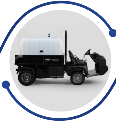
Back up water trucks